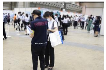
ブース訪問サポーター

病院探しに困ったら、病院情報のスペシャリスト「ブース訪問サポーター」に、個別にご相談できます。