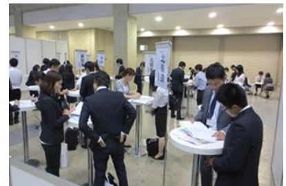
医学生キャリアなんでも相談コーナー

※病院のご案内については、ブース訪問サポーターでも承りますので、お気軽にご利用ください。