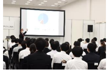
過去のセミナー開催イメージ

(2) 「データで読み解く最新マッチングのリアル！」ミニセミナー 経験豊富なレジナビの病院・医学生担当が、最新のデータに基づいたマッチングのリアルな情報や、その後すぐフェア会場で活かしてほしいことなど貴重な情報が満載のミニセミナーです。