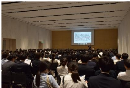
「レジナビフェア2025福岡」のセミナーの様子