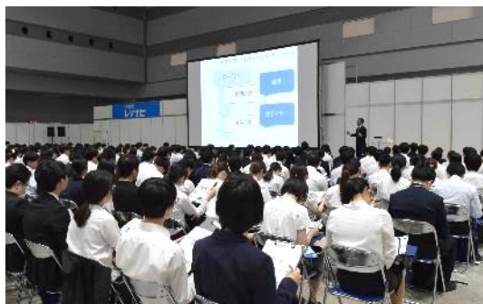
「レジナビフェア2025東京」セミナーの様子