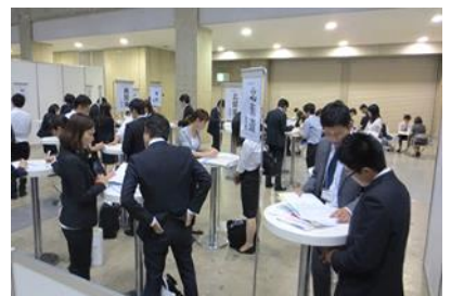
医学生キャリアなんでも相談コーナー

※病院のご案内については、ブース訪問サポーターでも承りますので、お気軽にご利用ください。