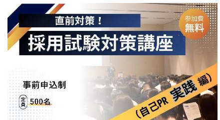
採用試験対策講座セミナーイメージ