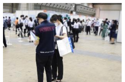
ブース訪問サポーター

病院探しに困ったら、病院情報のスペシャリスト「ブース訪問サポーター」に、個別にご相談できます。