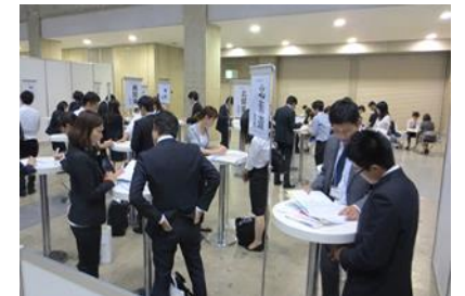
医学生キャリアなんでも相談コーナー

今後のキャリアや悩み事など、じっくり相談に乗ってほしい医学生に向けて、ドクターのキャリア支援をしているエージェントがお答えします。