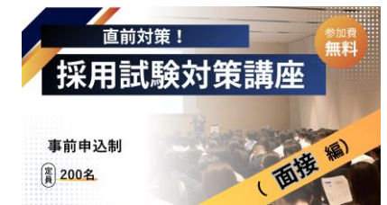
採用試験対策講座セミナーイメージ