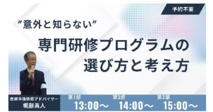
専門研修プログラムの選び方と考え方ミニセミナーイメージ

補足： 申し込みの事前予約は不要です。1回20分程度のセミナーですので、お気軽にご参加ください。