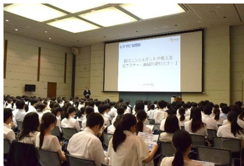
「レジナビフェア2025大阪」セミナーの様子